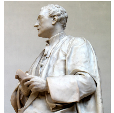
Isaac Newton (1643 – 1727), statuie de Louis Francois Roubiliac (1755), Trinity College Chapel (Cambridge)

14 Pe care dintre cărțile descoperite citind textul Roxanei Jidveian nu ai citit-o și ai vrea să o citești? Explică de ce.