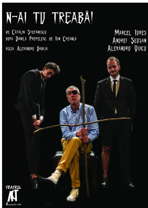
Afișul spectacolului N-ai tu treabă! , transpunere scenică a basmului Dănilă Prepeleac

( https://www.teatrulact.ro/movies/n-ai-tu-treaba )