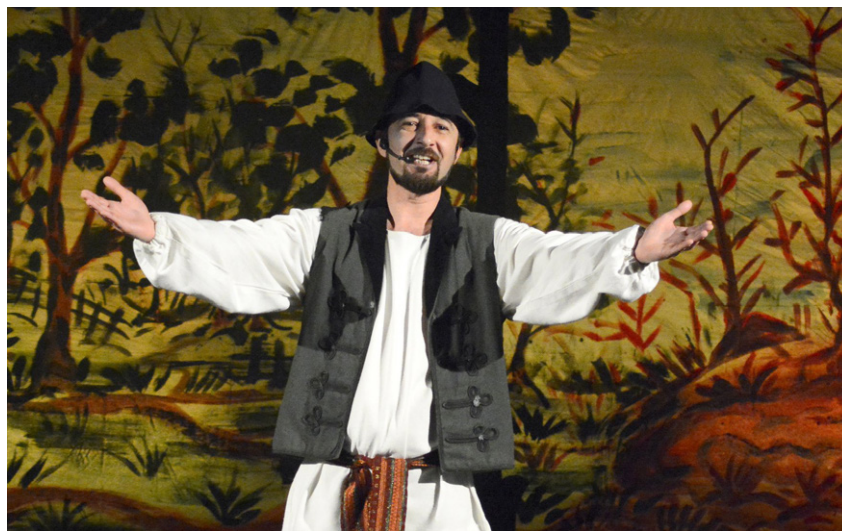
Scenă din spectacolul Dănilă Prepeleac în regia lui Boris Melinti, Teatrul Municipal Ariel din Râmnicu Vâlcea, 2018

Iară Dănilă Prepeleac, nemaifiind supărat de nimene și scăpând deasupra nevoiei, a mâncat și a băut și s-a desfătat până la adânci bătrânețe, văzându-și pe fiii fiilor săi împrejurul mesei sale.