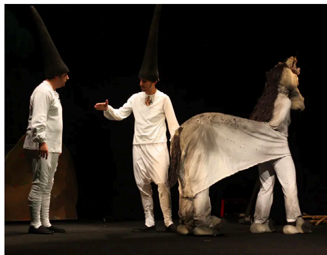
Scenă din spectacolul Dănilă Prepeleac în regia lui Ioan Brancu, Teatrul Țândărică