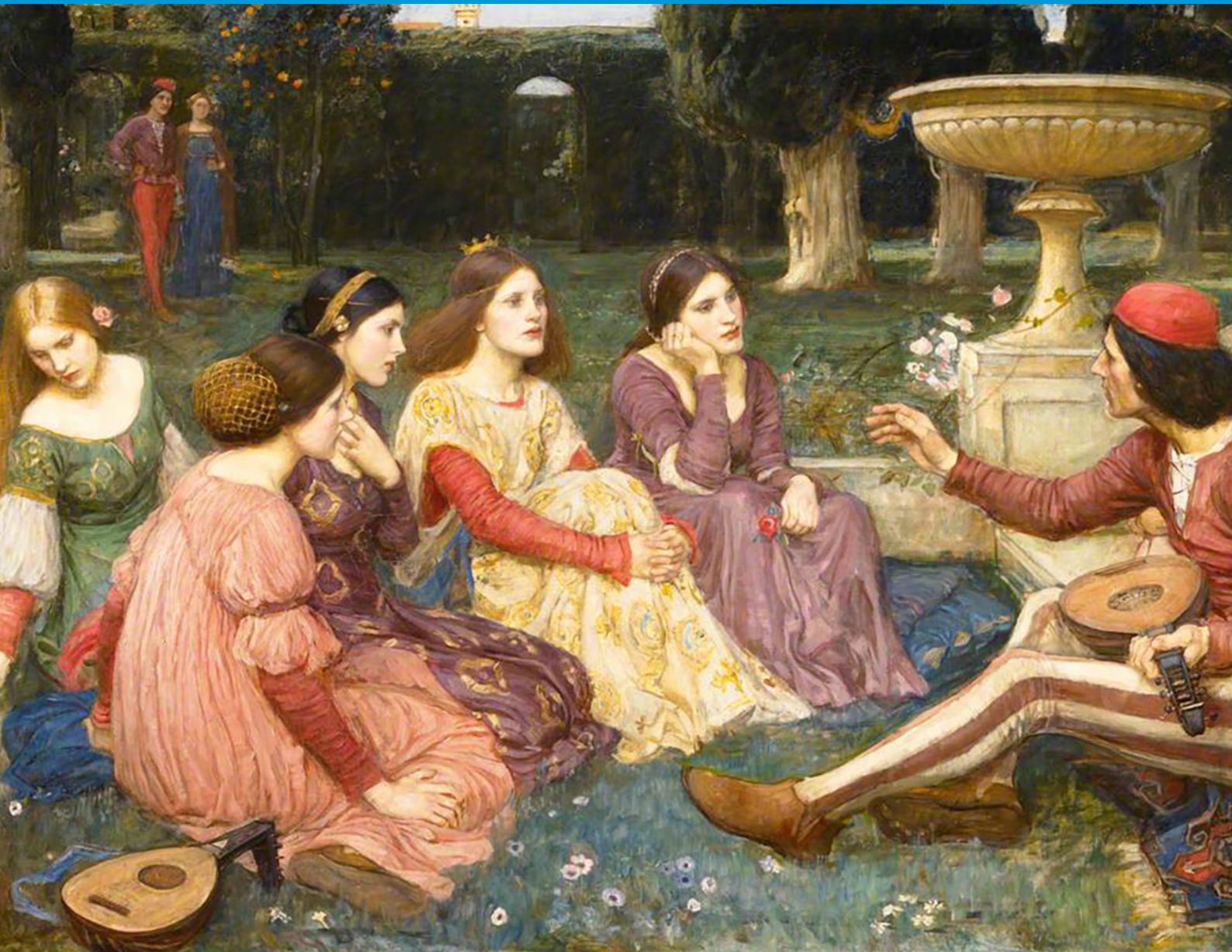
John William Waterhouse (1849-1917), Povestind, ascultând , scenă inspirată de Decameronul lui Giovanni Boccaccio