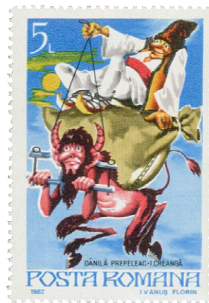
Timbru din 1982, cu o ilustrație de Florin Ivănuș pentru Dănilă Prepeleac

Pe când Dănilă se frământă cum să facă să ajungă cu banii acasă, apare al treilea drac din heleșteu. Acesta îi spune lui Dănilă că banii vor fi ai celui care va arunca mai tare în sus buzduganul pe care l-a adus cu el. Dănilă îi zice dracului