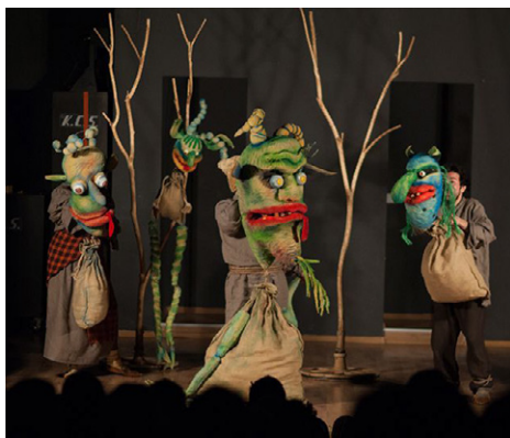
Scenă din spectacolul Dănilă Prepeleac realizat de Teatrul de păpuși Puck din Cluj-Napoca, 2022