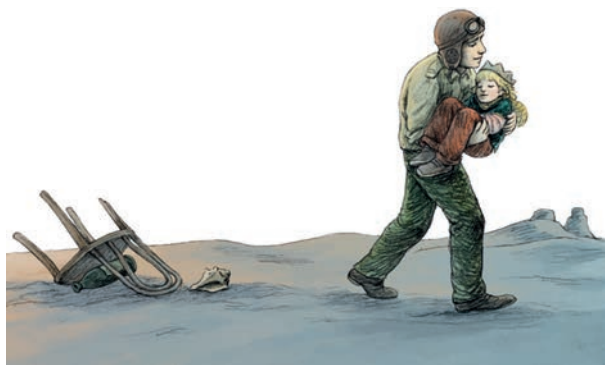
Ilustrație de Dan Ungureanu

Și, mergând astfel, am descoperit, în zori de zi, puțul.