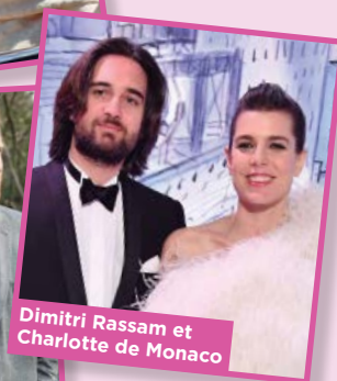
Dimitri Rassam et Charlotte de Monaco