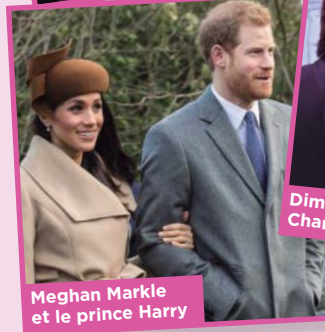
Meghan Markle et le prince Harry