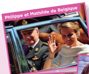
Philippe et Mathilde de Belgique

2019, l'année qui fait battre les cœurs des familles royales? Tandis que le couple Mathilde et Philippe de Belgique fêtent leurs noces de porcelaine, le prince Harry et Meghan Markle, après s'être dit oui, donnent naissance à un petit Archie, pendant que Charlotte de Monaco et son nouveau chéri Dimitri Rassam se passent la bague au doigt. Et nous, nous n'avons d'yeux que pour eux! De l'enterrement de vie de célibataire jusqu'au jour J, en passant par les préparatifs du mariage, les tourtereaux mettent soigneusement en scène leur amour sous nos yeux ébahis. Et dans la vraie vie? La tendance serait-elle aux mariages qui en mettent plein la vue? Les façons de manifester son amour pour son ou sa bien-aimé/e sont-elles en train d'évoluer? Face à ce retour en force du mariage, Votre Actu enquête, et pas seulement chez les têtes couronnées.