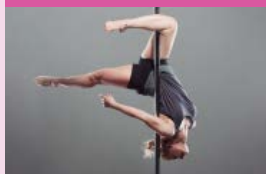
La pole dance