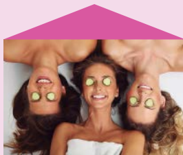
La journée au spa