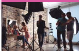
La séance photos