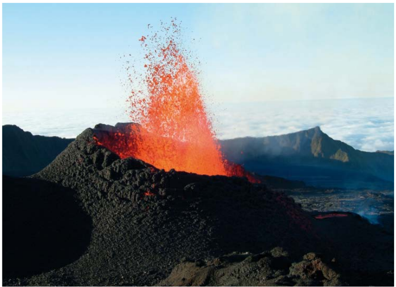
Le Piton de la Fournaise est un volcan actif qui culmine à 2632m.

Les élèves écoutent, fascinés, mais aussi choqués. Alors Mathieu cherche un autre sujet. Un sujet plutôt drôle.