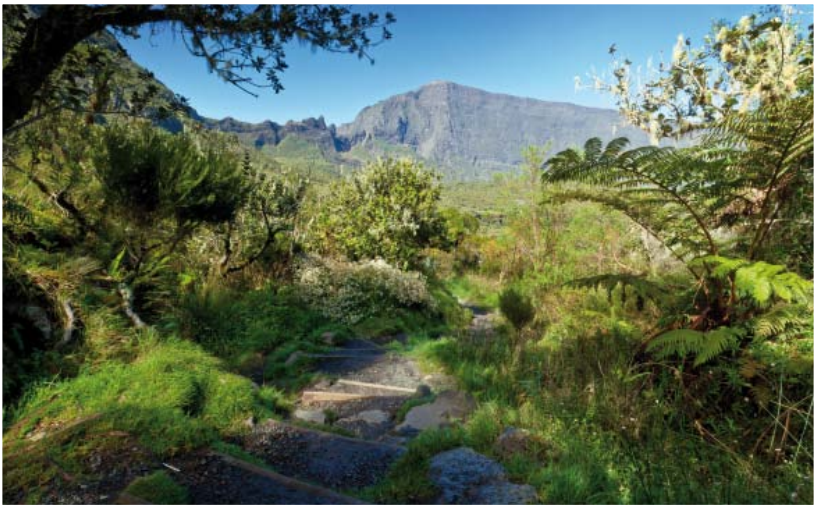
La Réunion est un département français d'outre-mer situé dans l'océan Indien près de Madagascar.