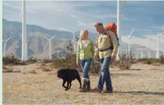
Ce sont mes parents avec leur chien Youki.