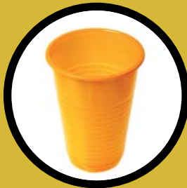
Vaso de plástico