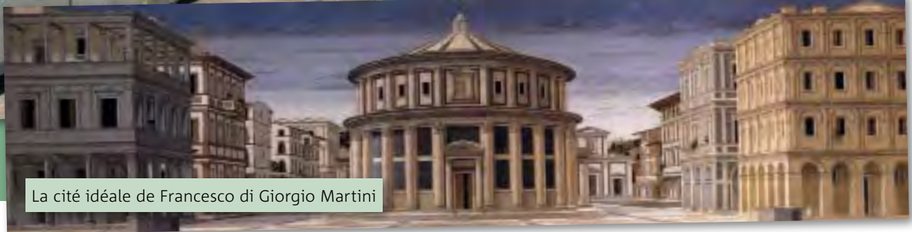
La cité idéale de Francesco di Giorgio Martini