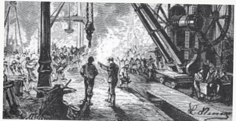
Stahlstadt, la Cité de l'Acier

Ce roman a été écrit par Paschal Grousset et remanié par Jules Verne, un grand écrivain français du XIX e , célèbre pour avoir écrit Le tour du monde en 80 jours et 20 000 lieues sous les mers .