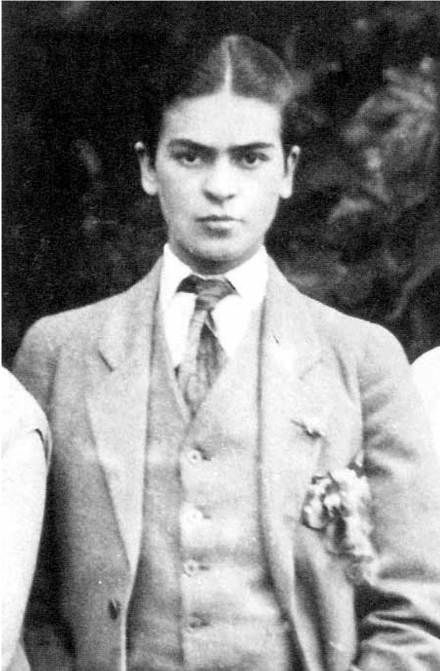
Frida con ropa de hombre en 1926 / Guillermo Kahlo