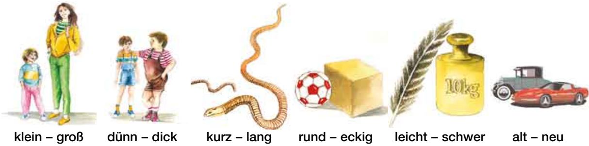
klein – groß