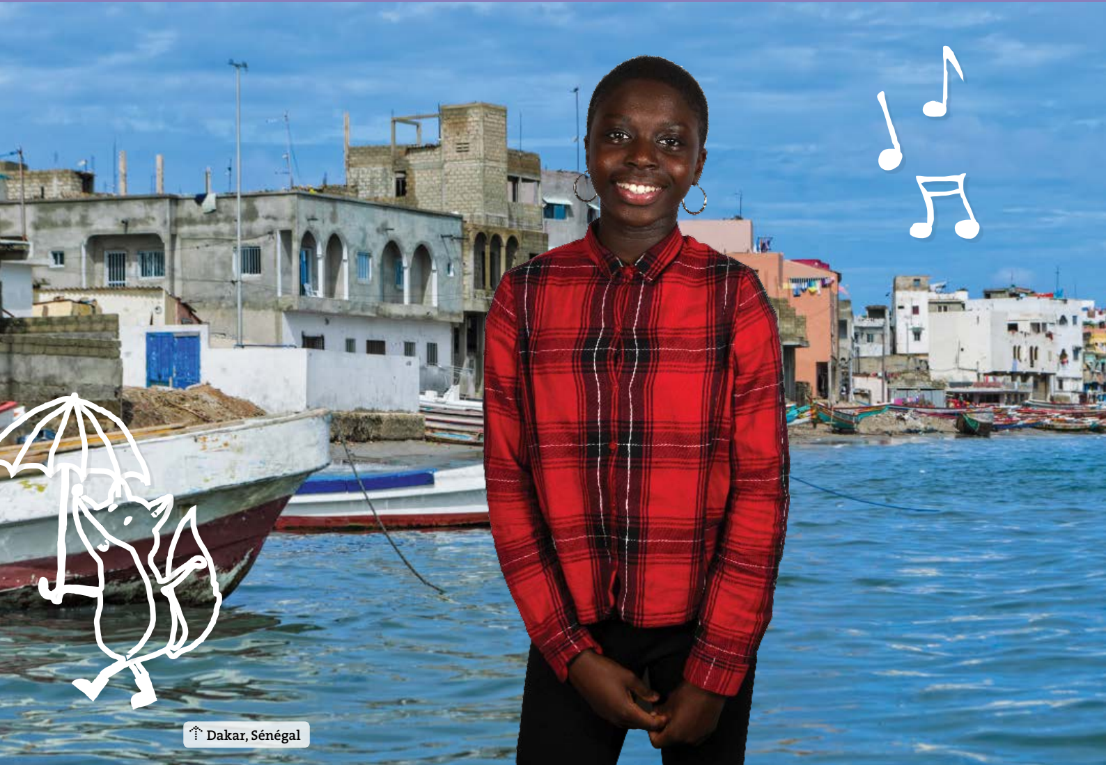
↑ Dakar, Sénégal