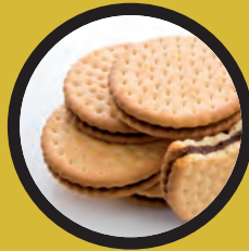
Galletas de chocolate