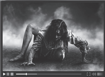
6 horror film