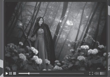
2 fantasy film