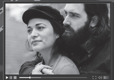
5 romantic film