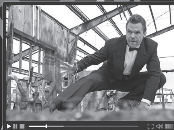
7 action film