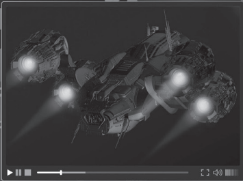
3 science fiction film